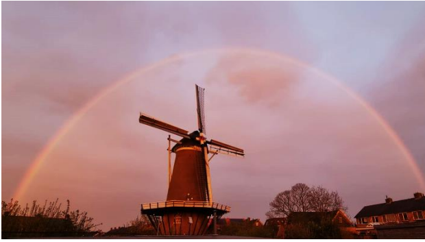
Een laag avondzonnetje schijnt in een vochtige hemel