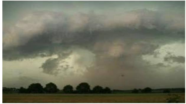
Een dreigende cumuluswolk met een donkergrijze basis.

Bij de foto linksboven is niets aan de hand, maar als er dreigende wolken voorbijtrekken zoals op de foto rechts, dan kan de molenaar na een laatste check beter thuis een kop koffie gaan drinken. Want hij wil natuurlijk geen enkel risico lopen met dit erfgoed dat aan hem is toevertrouwd.